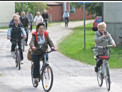
Radwanderung 24. Aug. Schloss Milkel