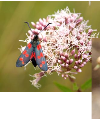
Schmetterlingswanderung in Droben am 2. Aug.