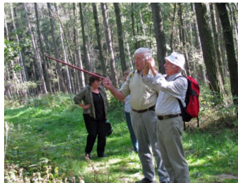
Wanderung Mönchswalde-Sora (09.Sep.)