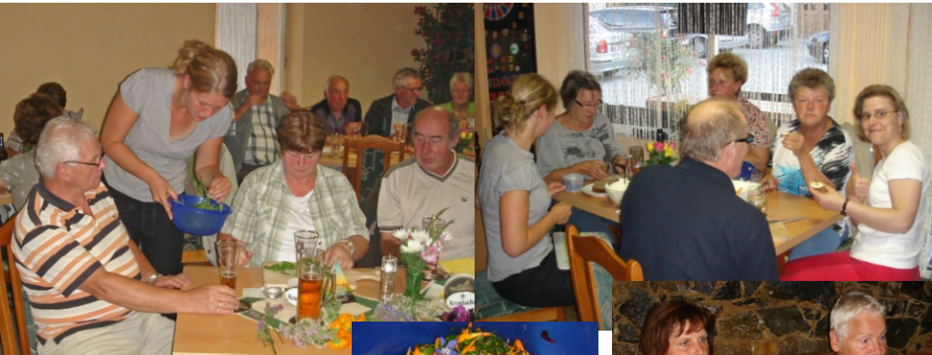
Seminar „essbare Blüten“ (13.Juli)