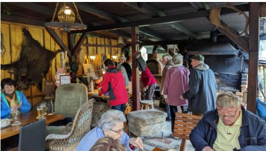
Ausfahrt Drehsa 4. Juni