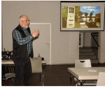
Jahreshauptversammlung 28. April